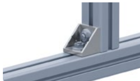
Aluwinkel 45 Alu Connection Angle 45